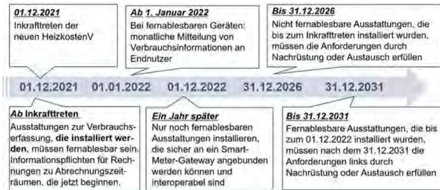
Abbildung 1: Wesentliche Pflichten nach HeizkostenV im Überblick anhand der Zeitskala ihres Inkrafttretens

Die folgende Abbildung zeigt die wesentlichen Pflichten im Überblick anhand der Zeitskala ihres Inkrafttretens.